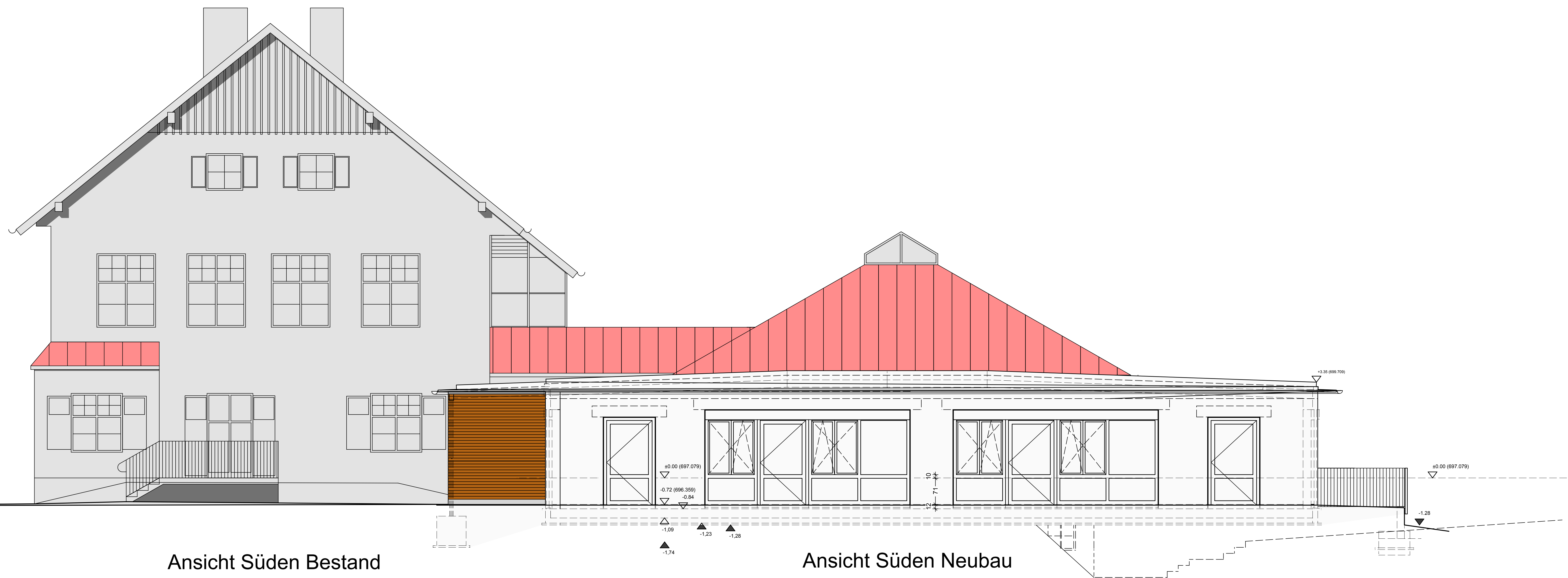
Ansicht Süden Bestand